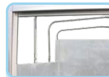
Kèo bạt có thể tháo lắp dễ dàng tùy theo nhu cầu sử dụng