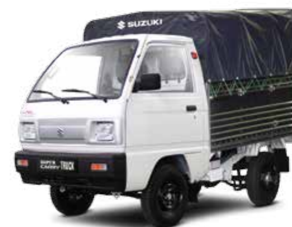
TRUCK MUI BẠT