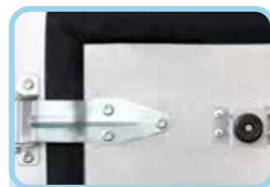
Bản lề nhập khẩu với chất liệu thép đúc