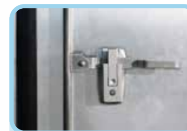
Khóa cửa thùng kiểu thép đúc được nhập khẩu