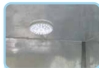
Đèn thùng & công tắc bên trong cabin được thiết kế thuận tiện