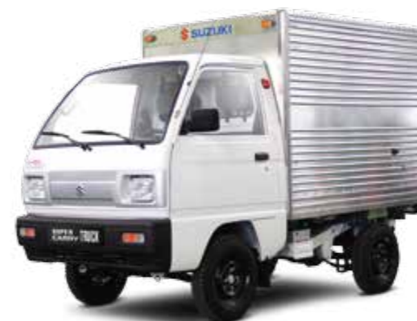
TRUCK THÙNG KÍN